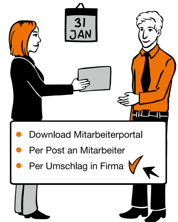
Möglichkeiten der Übergabe der Entgeltabrechnung.

HANSALOG fügt sich in Ihre IT-Landschaft ein. Die Software lässt sich auf allen gängigen Betriebssystemen und Datenbanken betreiben. Damit Sie Ihre Personalarbeit dezentral gestalten können, kann die Lösung auch über einen Intranet- oder Internet-Zugang laufen.